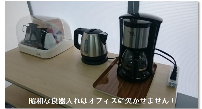
昭和な食器入れはオフィスに欠かせません！