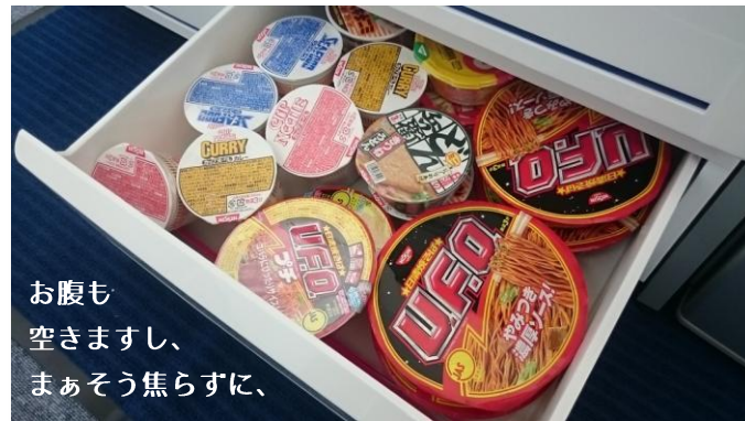
お腹も 空きますし、 まあそう焦らずに、