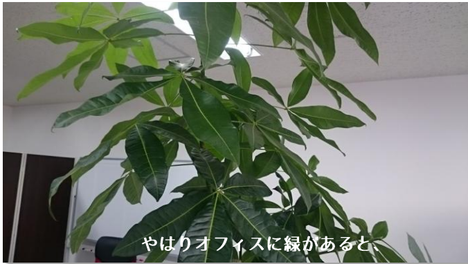
やはりオフィスに緑があると