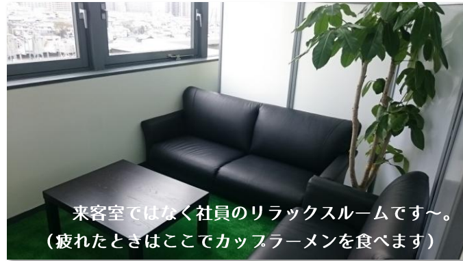
来客室ではなく社員のリラックスルームです～。 (疲れたときはここでカップラーメンを食べます)