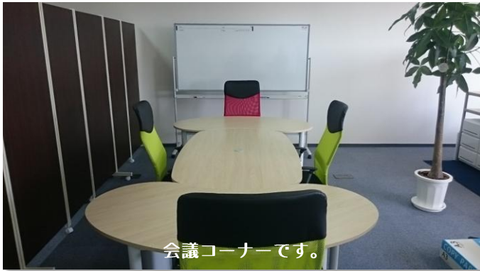
会議コーナーです。