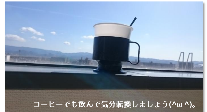
コーヒーでも飲んで気分転換しましょう(^ω^).