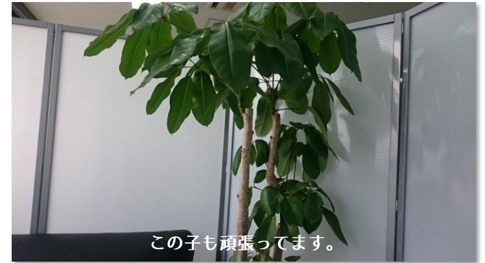
この子も頑張ってます。